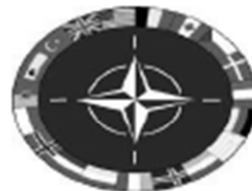
PÓŁNOCNO- ATLANTYCKA RADA WSPÓŁPRACY