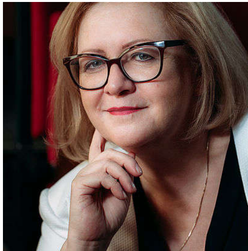
dr hab. Małgorzata Manowska