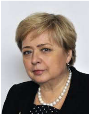
prof. dr hab. Małgorzata Gersdorf