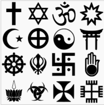
Różne symbole religijne, m.in. (pierwszy rząd) chrześcijaństwa, judaizmu, hinduizmu, bahaizmu, (drugi rząd) islamu, religii plemiennych, taoizmu, shintō (trzeci rząd) buddyzmu, sikhizmu, dżinizmu, ahimsa (czwarty rząd) Ayyavazhi, Potrójnej Bogini (Wicca), Krzyż maltański, przedchrześcijańskich Słowian