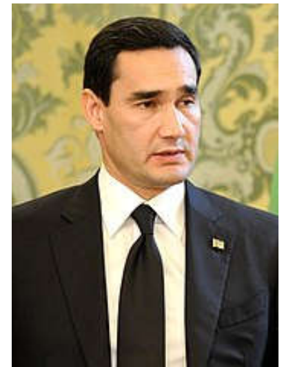
Serdar Gurbangulyýewiç Berdimuhamedow