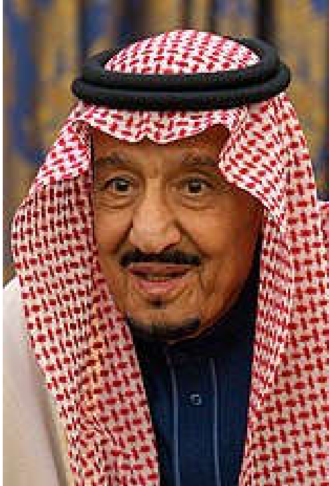
Salman ibn Abd al-Aziz Al Su'ud